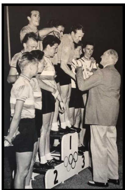
Sul podio di Melbourne premiati dal marchese di Exter.