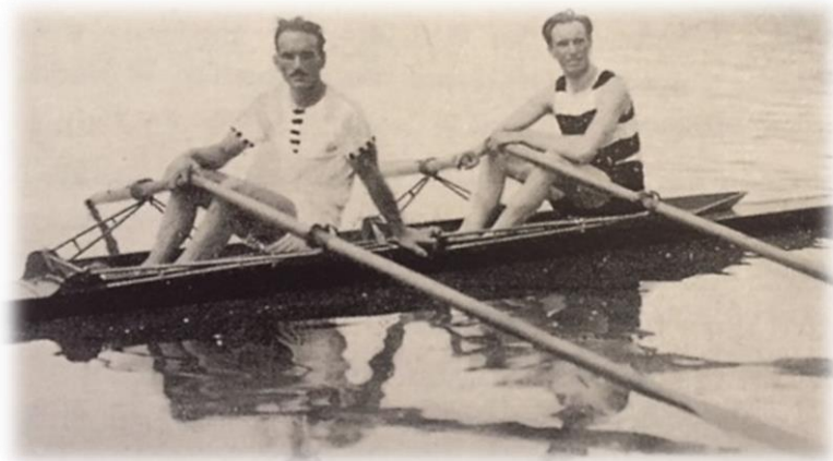
Dones e Annoni.