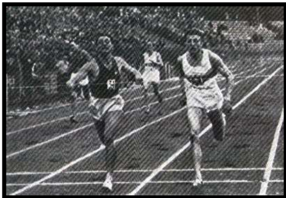
In attesa di poter disporre di una riproduzione migliore, questo è l'arrivo del doppio record europeo sul "giro" di Italia-Germania all'Arena.

NOTA. Ad eccezione della Semifinale di Berlino, per le altre otto riunioni di questa sezione, non è stata rintracciata alcuna foto degli arrivi dei 400. Sarebbe molto gradito venire smentiti.