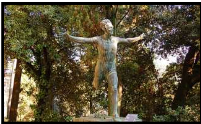
Il monumento funebre di Gargiullo al Cimitero di Staglieno. 5