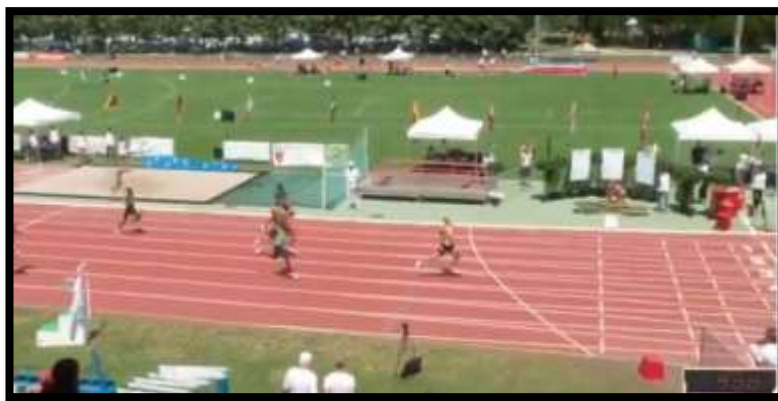
La vittoria con largo margine di Re a Ginevra, 45"01, nuovo record nazionale.