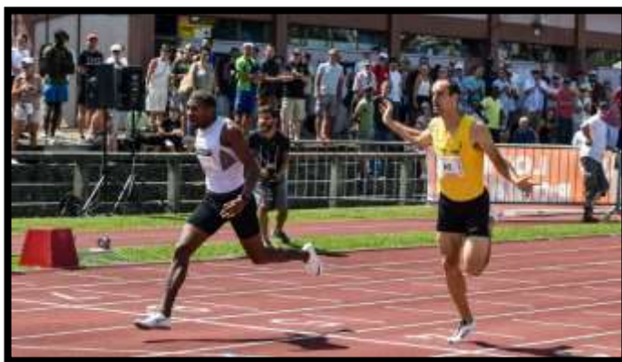
L'arrivo di Re a Chaux-de-Fonds.

📖 Tre anni più tardi si aprì l'era Re, tredicesimo italiano a detenere il record dei 400: questo in fotografia è il primo dei suoi due primati "svizzeri", peraltro ottenuto ad un'altitudine leggermente inferiore a quella di Rieti. A causa di un violento nubifragio, il meeting venne sospeso intorno alle 16,45 con diverse gare cancellate del tutto. Record personali di Re: 45"79 nel 2017, 45"31 nel 2018.