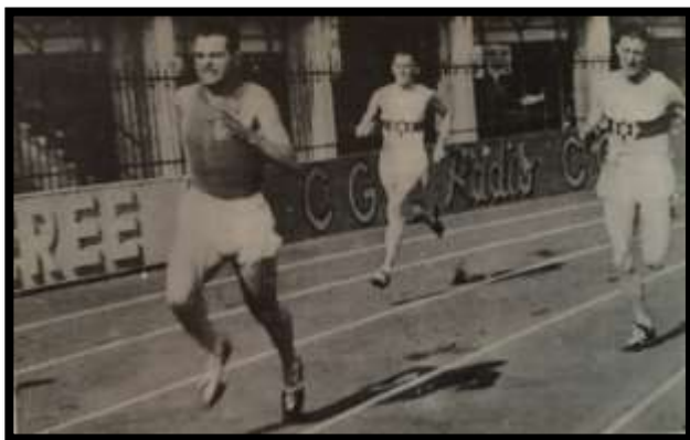
Bologna, 29 Giugno 1941, Italia-Germania in tempo di guerra: una delle rare vittorie di Lanzi (47"1) su Harbig (47"2), capace quell'anno di ripetersi a 46"7.