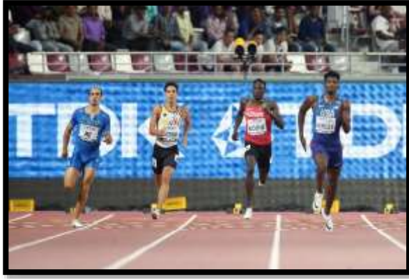
L'ingresso in dirittura dei primi 4 della Semifinale di Doha '19.