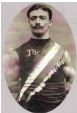
Il novarese Umberto Barozzi, primo primatista dei 100 metri (1908).