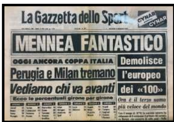
La Gazzetta del 5 Settembre 1979.

📖 Il nuovo record sostituiva il 10"07 di Valery Borzov (URS) ottenuto nei Quarti ai Giochi di Monaco (31 Agosto 1972). All'epoca il 10"01(A) era il terzo crono mondiale in assoluto dopo il 9"95(A) di Jim Hines (USA) ai Giochi del Messico 1968 e il 9"98(A) di Silvio Leonard (CUB) alla World Cup di Guadalajara del 1977, prestazioni entrambe ottenute in altura. A livello del mare, il risultato più veloce apparteneva sempre a Leonard che all'Avana aveva corso in 10"03 due anni prima (13 Settembre 1977).