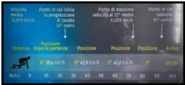
Sopra, rappresentazione grafica della corsa di Jacobs in onda sulla RAI ad Unomattina Estate (6 Agosto 2021) nel corso di una intervista all'allenatore Paolo Camossi. Sotto, l'elaborazione della Finale secondo uno studio della Gazzetta dello Sport (2 Agosto 2021).