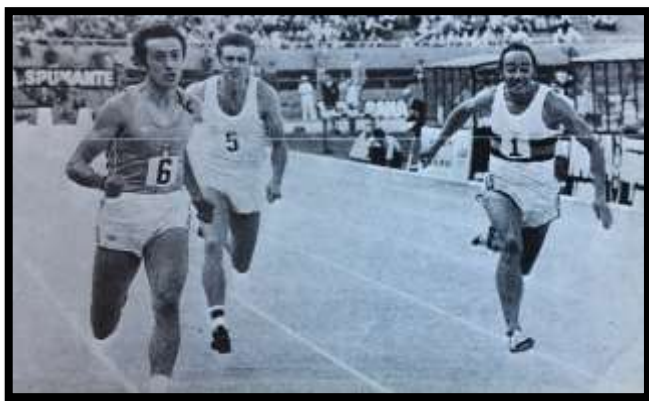
Il 10"20 nella Semifinale di Coppa Europa 1975 a Torino.

10"20 0,0 Pietro MENNEA (ALCO Rieti) [*28 Giu 1952] Torino 12 Lug 1975 "Semifinale Coppa Europa." Stadio Comunale. Pista in Tartan. Spettatori: ca. 15.000. Prima giornata. – 100 m: 1. Pietro Mennea 10"20 [corsia 7], 2. Klaus Ehl (FRG) 10"52, 3. Lambert Micha (BEL) 10"59 [5], 4. Juraj Demec (TCH) 10"66 [6], 5. Lajos Gresa (HUN) 10"72, 6. Adalbert Darvas (ROU) 10"89.