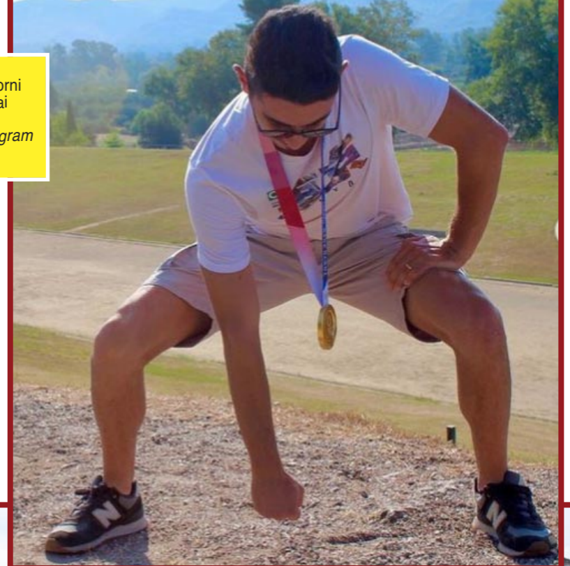
Massimo Stano a Olympia, pochi giorni dopo il successo ai Giochi di Tokyo.

Poi racconta di Alberobello. «È stato molto divertente ma più dura del previsto rispetto alla prova di Dudince. Ci tenevo tantissimo a vincere nella mia terra da campione olimpico e su un percorso meraviglioso come questo. Ma nelle gambe sentivo i chilometri della 35 e ho deciso di partire tranquillo. Gli altri ragazzi hanno cercato di trarne vantaggio ma sono riuscito a fare la mia gara e a rimanere con loro prima dello strappo a cinque chilometri dalla fine». Uno strappo imperioso fino al successo tra la sua gente. Guai a sfidarlo sul suo terreno: se gli lanci una sfida la perdi di sicuro. Nel suo entourage ne sono più che convinti e per questo lo lasciano