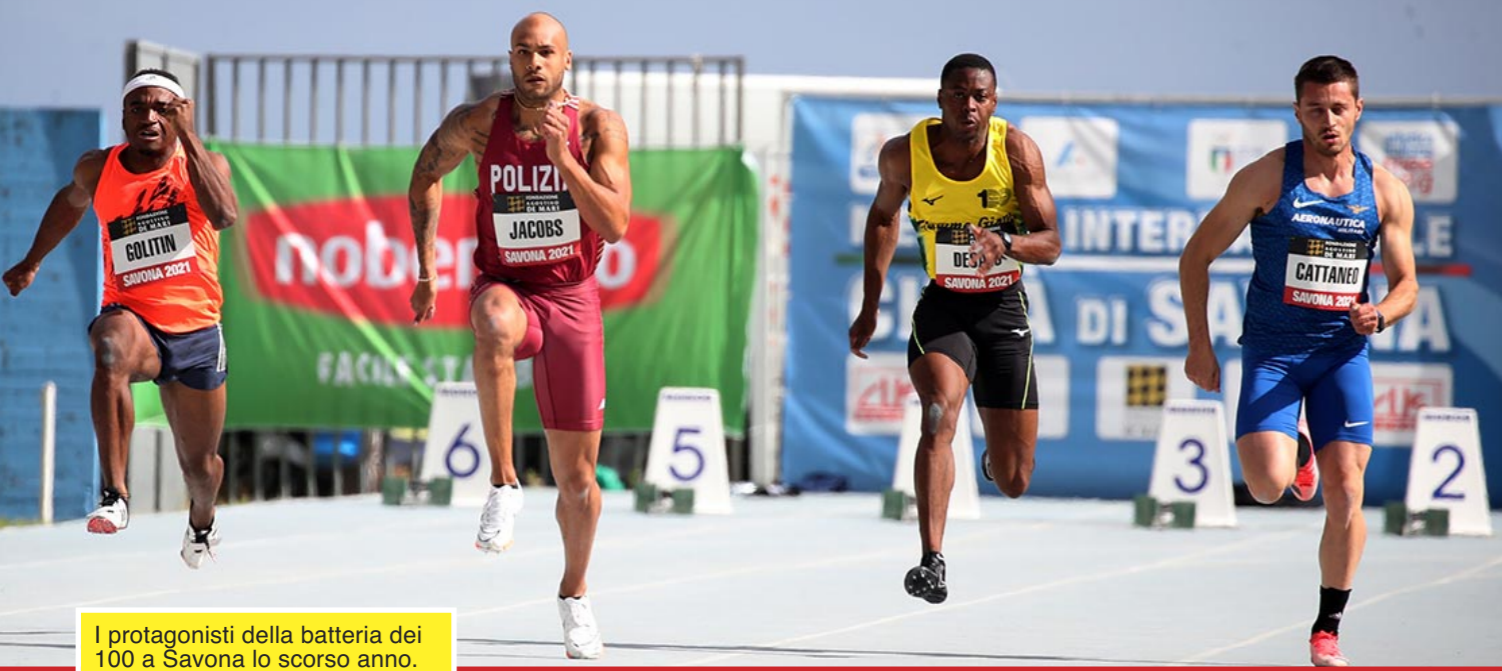
I protagonisti della batteria dei 100 a Savona lo scorso anno.

mato italiano dei 100 metri. Non era la finale, ma MJ diede tutto sé stesso, le condizioni atmosferiche erano favorevoli, il vento soffiava a favore (+1,5). Poi non corse la finale, raccontò la sua vita a tre pennivendoli che pendevano dalle sue labbra. Oggi, invece, qualcosa è cambiato, i pennivendoli e/o gazzettieri sono diventati 20, si sono scomodati da Parigi (Le Figaro) Renè Bouscatel e dal Regno Unito è arrivato Matt Cotton (The Times) entrambi più noti nel mondo ovale, ma si sa che tra il rugby e il Track e field, ci sono delle affinità. Hanno trovato uno scranno comodo davanti alla tribuna d'arrivo, che come tutti sanno alla Fontanassa è la tribuna opposta. Il campo è stato omologato, da anni, per permettere di usufruire del vento cha arriva dal mare, se arriva, ovviamente. Anche questa volta Eolo è stato dalla parte di MJ, ha iniziato verso le quattro del pomeriggio a fare sentire la sua dolce brezza che è stata misurata in... Pazientate gente, pazientate, il racconto deve continuare. Un briciolo di suspense, perché no. MJ con