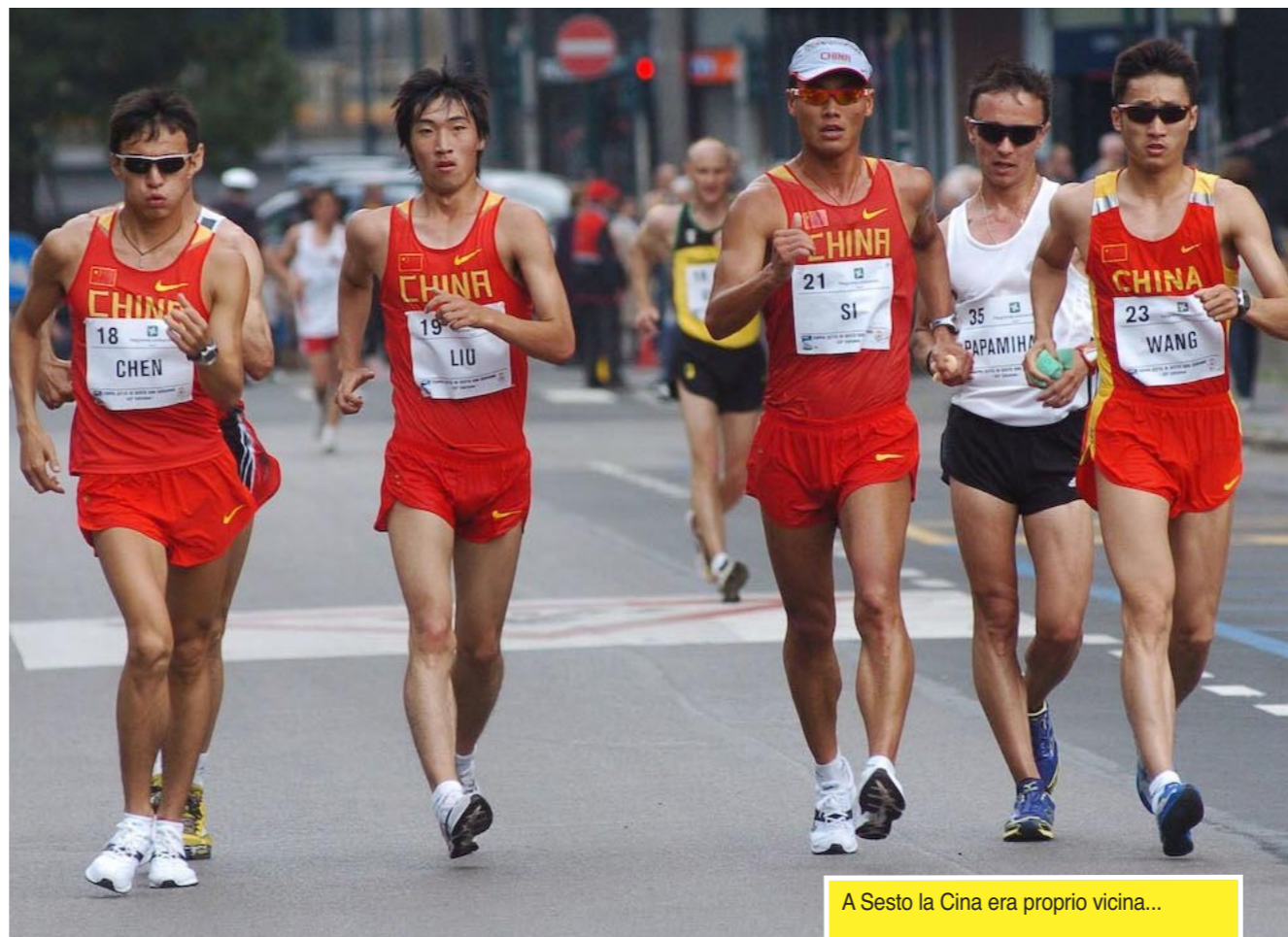
A Sesto la Cina era proprio vicina...