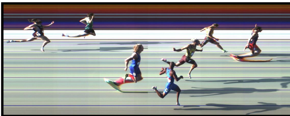
Rieti, 26 Giugno: Finale CN

MEDIA PUNTI PRIMI 10 = p. 1122 (45"84) 100° PRESTAZIONE ALL-TIME = 45"86