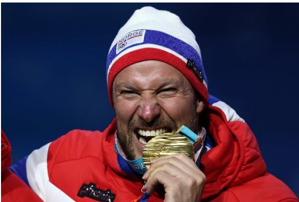
Finalmente l'oro olimpico per Aksel Svindal.