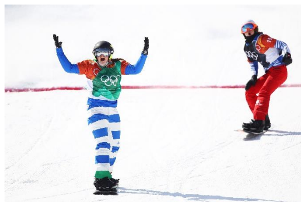
Michela Moioli vince lo SB-Cross di PyeongChang.

... 8. Raffaella Brutto, Small Fin. (2.) 320 (Qlf. [19.] 1'21"4; 3-Qt. [3.]; 2-Sf., n.class.; Small Fin [2.]