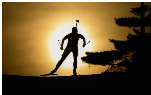
Lo svizzero Super-Dario Cologna al terzo titolo olimpico.