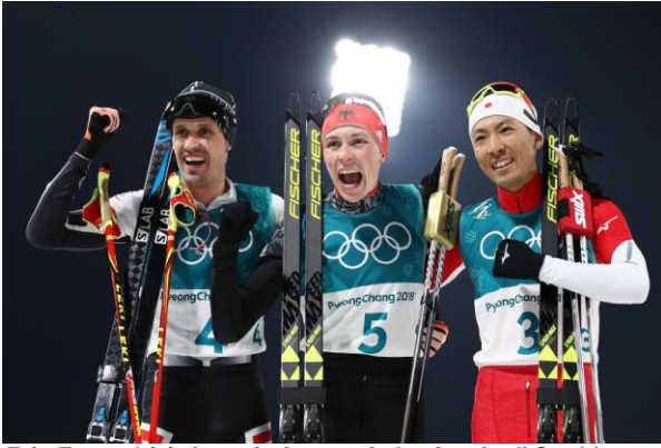
Eric Frenzel (5) ripete in fotocopia la vittoria di Sochi.