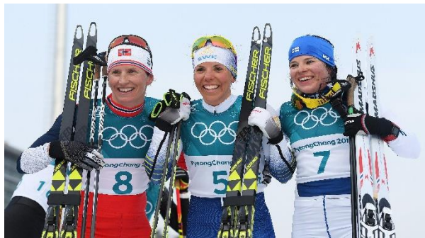
Il primo podio di PyeongChang 2018.

1. Charlotte Kalla SWE 40'44"9 2. Marit Bjoergen NOR 40'52"7 3. Krista Parmakoski FIN 40'55"0