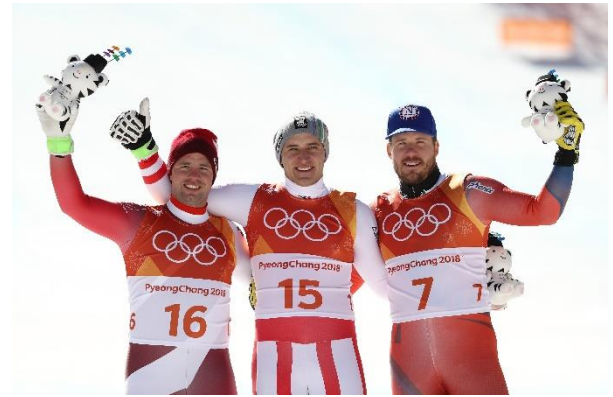
Matthias Mayer: oro in Super-G come in Discesa a Sochi.