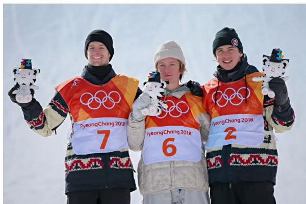
Prima medaglia d'oro degli USA su una coppia canadese.