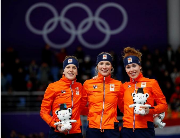
Podio tutto "orange" per i 3000 metri.