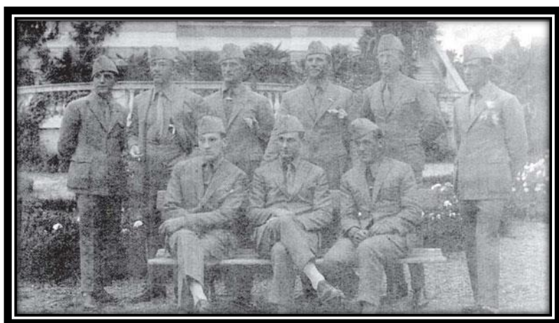
Paragl '24: Diadora Zara.