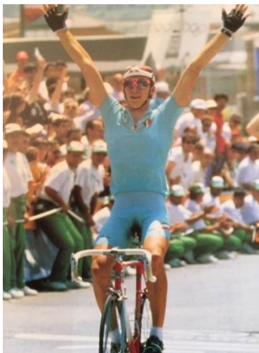
Fabio Casartelli sul traguardo di Barcellona.