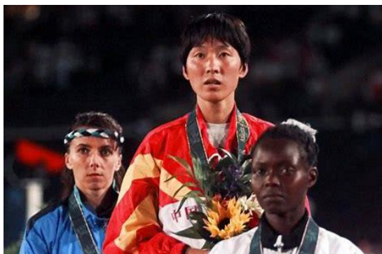
Il podio di Atlanta '96.